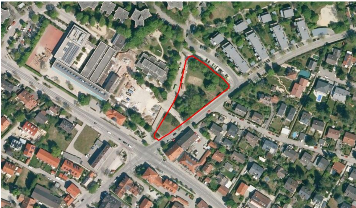
Abbildung 1: Luftbild mit eingezeichnetem Geltungsbereich (rote Schraffur)

In unmittelbarer Umgebung zum Eingriff gibt es keine naturschutzfachlich wertvollen Flächen. In ca. 205 m Entfernung grenzt hinter der Wohnbebauung im Norden das LSG Forstenrieder Park einschließlich Forst Kasten und Fürstenrieder Wald an.