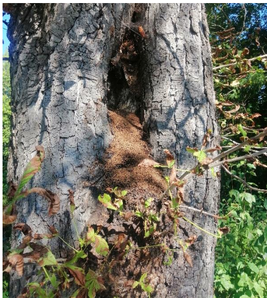
Abbildung 5: Höhle in alter Kastanie