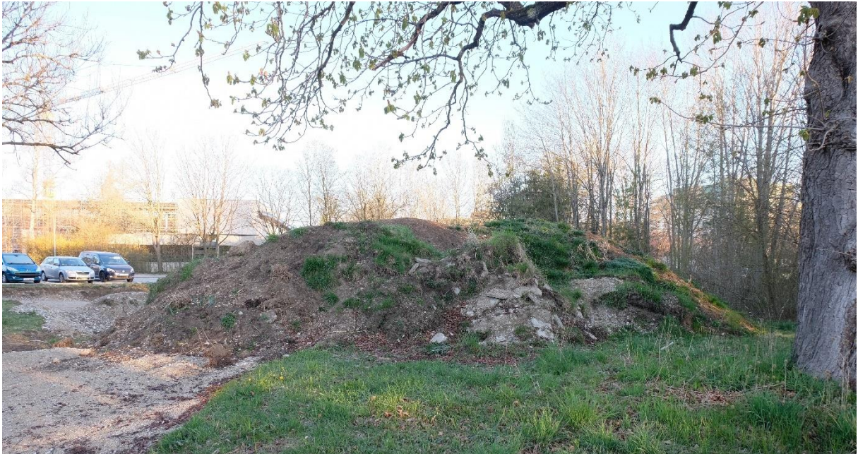
Abbildung 2: Blick nach Norden mit einem Teil der alten Kastanie, den Substratablagerungen und dem Gehölz im Hintergrund