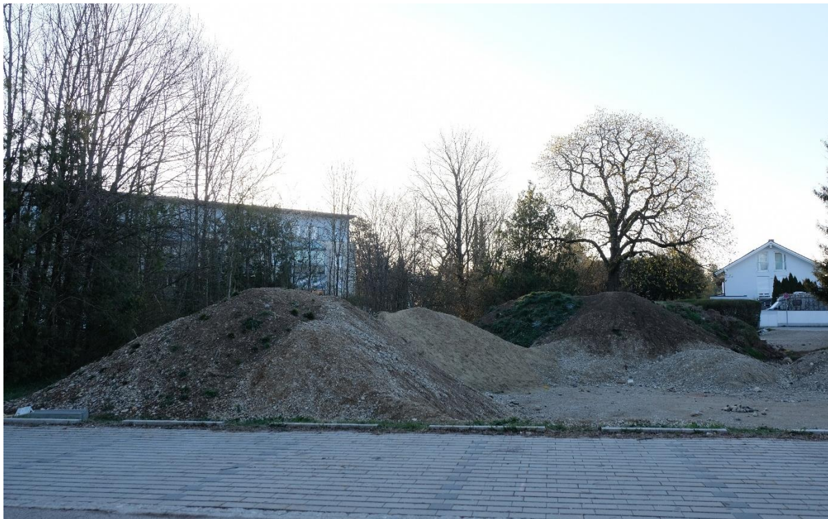
Abbildung 4: Blick von West nach Ost mit den Substratablagerungen und der alten Kastanie im Hintergrund

von Links ist oben das Krähenest zu sehen