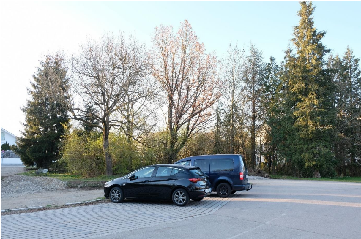
Abbildung 3: Blick nach Südosten mit Parkfläche im Vordergrund und den Bäumen im Hintergrund. Im dritten Baum