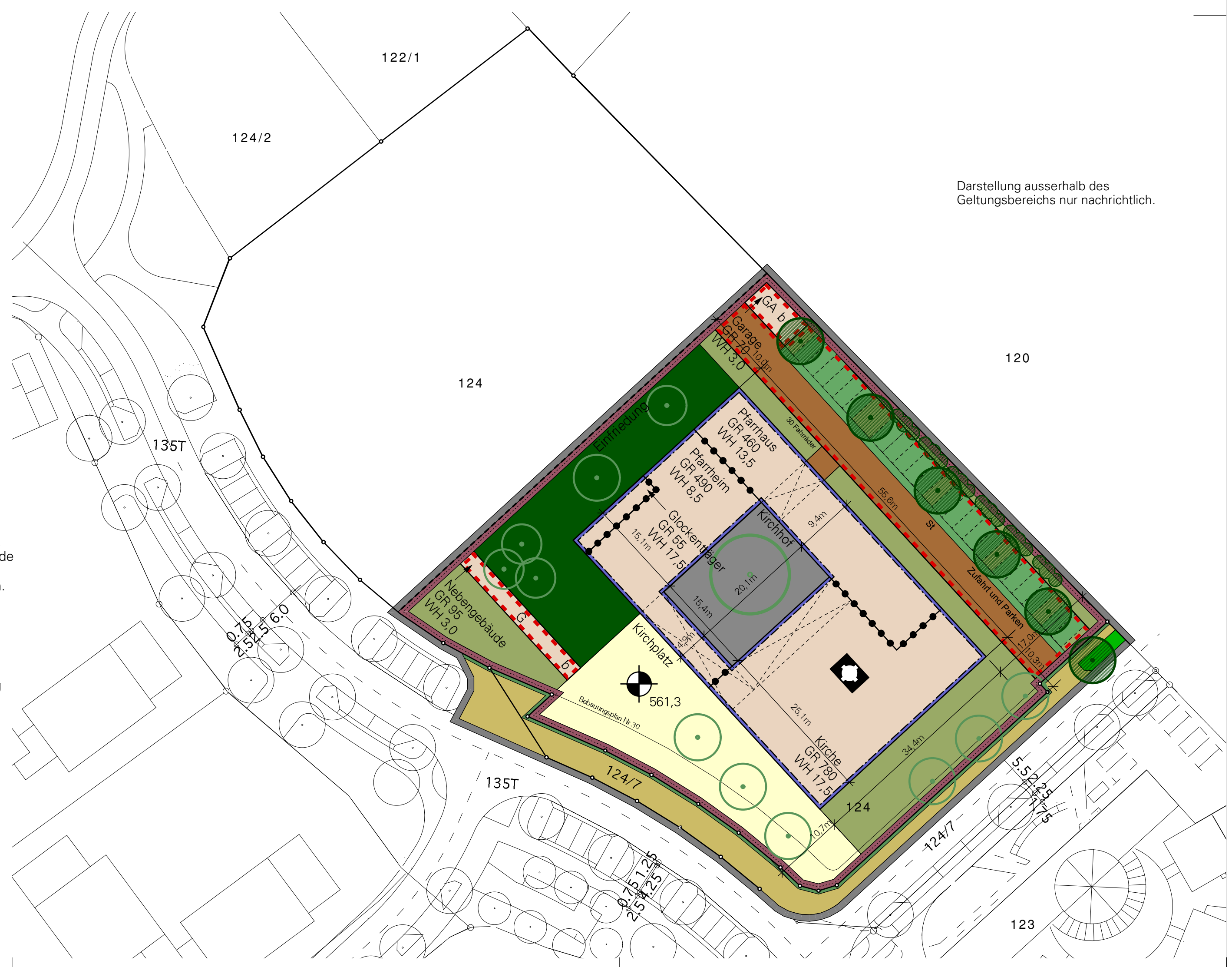
Darstellung ausserhalb des Geltungsbereichs nur nachrichtlich.