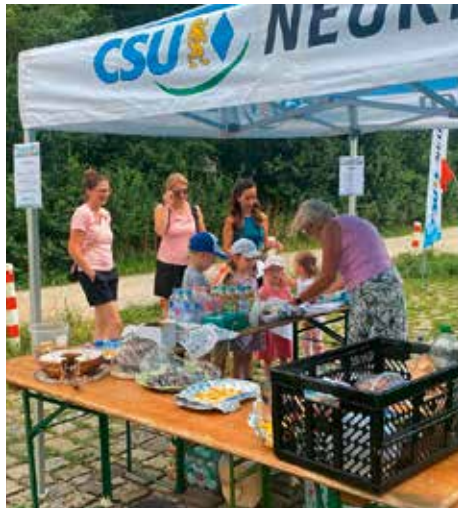
Großer Andrang bei der Schnitzeljagd

Die von der CSU und Frauenunion Neuried organisierte Schnitzeljagd war ein voller Erfolg und begeisterte die ganze Familie. Rund 150 Teilnehmer genossen die spannende Route durch den Wald. Trotz eines kurzen Regenschauers waren die Besucher begeistert.