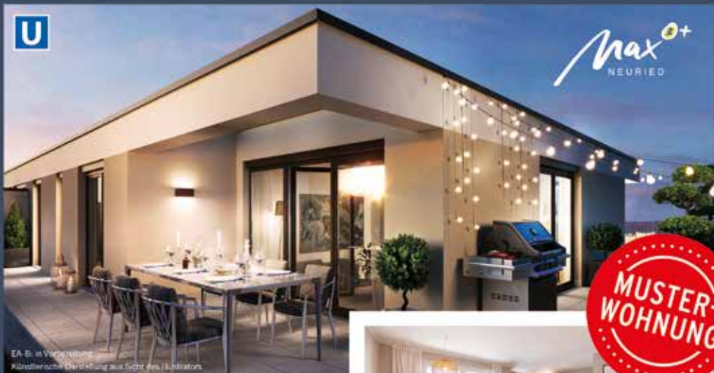
EA-B. in Vorbereitung Wiederliche Darstellung aus Sicht des Illustrators