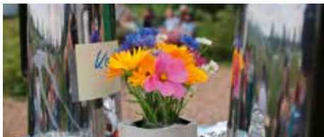
Sommerfest im Krautgarten

ters schon wieder zu Ende. Aber bis dahin konnten wir uns an den vielen Leckereien erfreuen, die aus dem Bauerngarten und dem Krautgarten beige-steuert wurden. Vielen Dank an unsere AG Feste & Feiern, die sich wieder voll ins Zeug gelegt hat. Zum ersten Mal nahm ein Team aus dem Krautgarten am 21. Juli bei der Dorfmeisterschaft des EC Neuried e.V. teil und belegte als „Team Zitronengras“ einen hervorragenden sechsten Platz (von 12 teilnehmenden Teams).