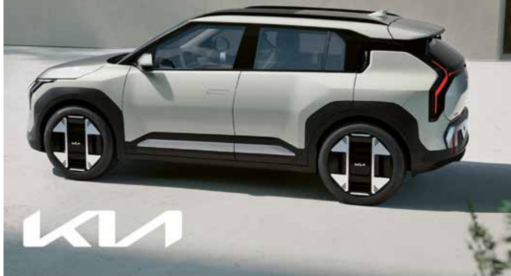
Abbildung zeigt kostenpflichtige Sonderausstattung.

Dein exklusives Kennenlernen mit dem neuen Kia EV3.