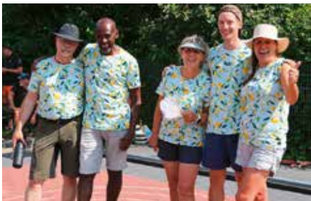
Team „Zitronengras“ bei der EC Dorfmeisterschaft Neuried

ters schon wieder zu Ende. Aber bis dahin konnten wir uns an den vielen Leckereien erfreuen, die aus dem Bauerngarten und dem Krautgarten beige-steuert wurden. Vielen Dank an unsere AG Feste & Feiern, die sich wieder voll ins Zeug gelegt hat. Zum ersten Mal nahm ein Team aus dem Krautgarten am 21. Juli bei der Dorfmeisterschaft des EC Neuried e.V. teil und belegte als „Team Zitronengras“ einen hervorragenden sechsten Platz (von 12 teilnehmenden Teams).