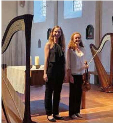
Die Künstlerinnen genießen den Applaus des begeisterten Publikums