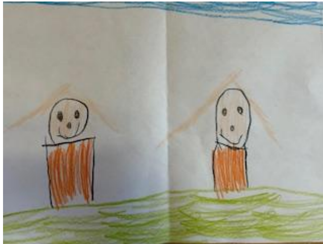
Abbildung 13: Zusammenarbeit ist uns wichtig!