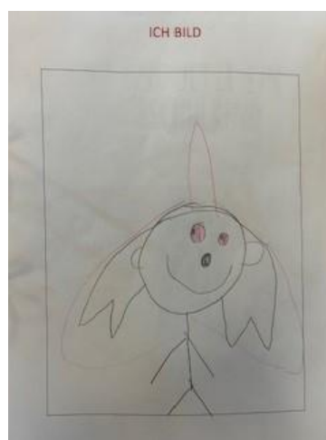
Abbildung 10: "Das bin ich!"

Jedes Kind erhält am Anfang seiner Krippen- und/oder Kindergartenzeit seinen eigenen Ordner und darf diesen beim Abschied mitnehmen. Die Ordner enthalten zum Beispiel Fotos und gemalte Bilder der Kinder.