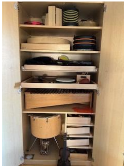
Abbildung 7: Instrumente für die Musikalische Früherziehung

Aktivitäten rund um die Musik sind ein durchgängiges Prinzip im pädagogischen Alltag und finden sich im Tagesablauf wieder. Die Musik sensibilisiert alle Sinne und spricht viele Emotionen an. Sie fördert die Lebensfreude und ist ein wesentlicher Bestandteil der Erlebniswelt eines Kindes. Musik leistet einen wichtigen Beitrag für die Pflege der eigenen Tradition sowie für die interkulturelle Begegnung und Verständigung.