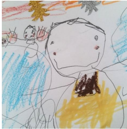
Abbildung 5: Unser Bild vom Kind

Hilfsbereit, freundlich, eigenes Tempo, individuell, selbstständig, fantasievoll, neugierig, vertrauensvoll, ehrlich und vorurteilsfrei, haben eine eigene Persönlichkeit, emotional, lustig/humorvoll, respektvoll, selbstbestimmend, empathisch, lebensfroh, beobachtend – und noch vieles mehr 😊