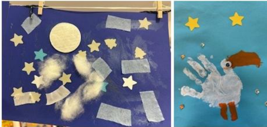
Abbildung 9: Ästhetisch-kreative Bildung

Die ästhetisch- kreative Bildung wird in unserer Einrichtung durch vielfältige Projekte und Arbeiten gefördert. Die Kinder haben während der Freispielzeit zahlreiche Möglichkeiten sich selbstbestimmt kreativ zu betätigen.