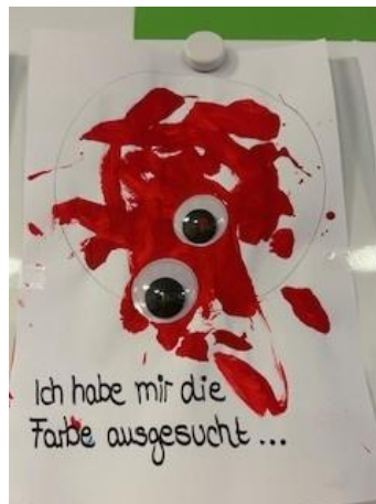
Abbildung 6: Partizipation in der Kita

Demokratie leben und einüben, das beginnt in der Familie oder eben in der Kita. Dass auch Kinder ein Recht auf Beteiligung haben, ist in der UN-Kinderrechtskonvention, der EU-Grundrechtscharta und auch im Kinder- und Jugendhilferecht verankert. Das wachsende Bedürfnis des Kindes nach selbstständigem und verantwortungsbewusstem Handeln ist eine gewünschte Persönlichkeitsentwicklung.