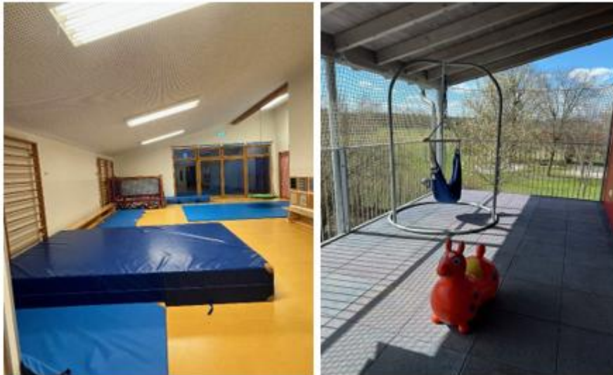
Abbildung 8: Bewegungsförderung

Den Krippenkindern steht zusätzlich zur großen Turnhalle die kleine Halle im unteren Garderobenbereich während der Freispielzeit zur Verfügung.