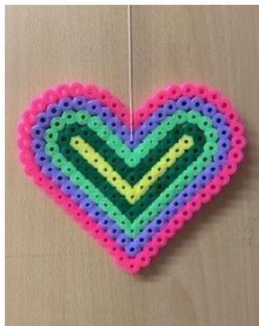
Abbildung 11: Eingewöhnung mit Herz

Die starke Einbeziehung der Eltern in die Eingewöhnungsphase ist ein Merkmal für die Qualität. In der Praxis hat sich gezeigt, dass es sehr bedeutsam ist, die Schritte der Eingewöhnung individuell an die Bedürfnisse des Kindes anzupassen. Eltern sollten für die Eingewöhnung ein Zeitfenster von etwa drei bis vier Wochen einplanen.