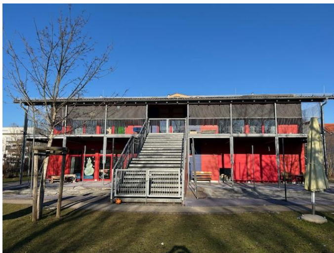
Abbildung 1: Außenansicht des Kinderhauses (Gartenseite)

Das Kinderhaus ist in moderner Modulbauweise mit einer rot-blau-grauen Außenverkleidung mit vielen verschiedenen Fenstern und Pultdach gebaut. Es besteht aus zwei Stockwerken und einem geräumigen Keller. Ein großer, überdachter Südbalkon sowie eine überdachte Terrasse und eine breite Außentreppe als Zugang zum Garten vervollkommen das freundliche Äußere.