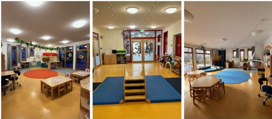
Abbildung 2: Räumlichkeiten des Kinderhauses (Krippe)

Im Erdgeschoss gelangt man durch einen hellen freundlichen Eingangsbereich zunächst zu den Garderoben und anschließend in die beiden Krippengruppenräumen ( Sonnengruppe und Regenbogengruppe ), die jeweils mit direktem Zugang zum Schlaf- und zum Wickelraum versehen sind. Die Räume präsentieren sich je durch eine große Fensterfront und mehrere kleine Fenster. Jeder Raum verfügt über eine eigene Küchenzeile.