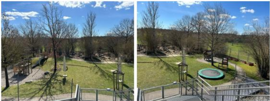
Abbildung 4: Außenanlage des Kinderhauses

Durch die Gruppenräume gelangt man in den großzügig angelegten, eingezäunten Garten mit altem Baumbestand. Hier finden sich zwei große mit Sonnensegeln überdachte, abdeckbare Sandkästen, die mit Fallschutzboden umrahmt sind.