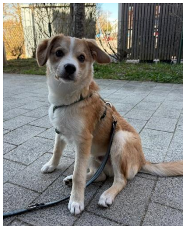
Abbildung 12: Bürohund Bertl